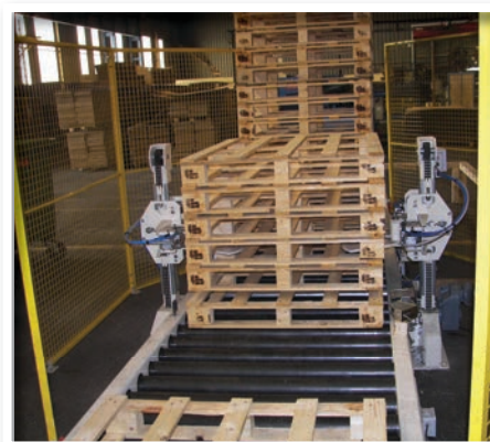
Empileur / Dépileur