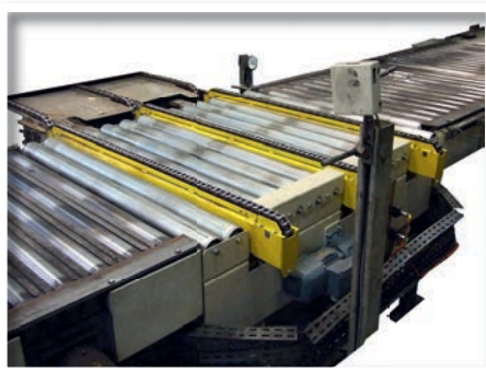
Transfert à chaînes à 90°