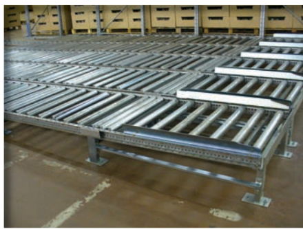
Pieds supports fixes Guide d'entrée latéral