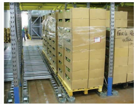
Entrée ou sortie 2 ou 3 chemins