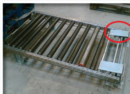
Loquet de sécurité sur séparateur