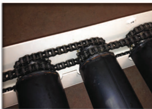
Transmission par chaînes bracelets