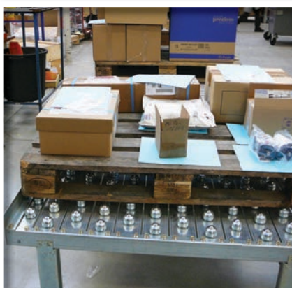
Table à billes

Pied réglable en hauteur Guide latéral Butée d'extrémité fixe Butoir Butée anti retour Butée escamotable manuelle Table à billes Portillon Rails palettes