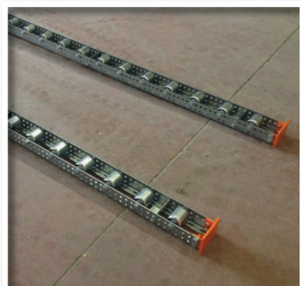
Rails palettes au sol