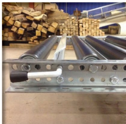
Butée anti retour

Charge admissible de 100 à 1000Kg par mètre linéaire. Rouleaux Ø60 en acier brut ou zingué. Longeron galvanisé profilé en C de type BU74 dimension 70x40x40x4 ou en L de type ML74 70x40x4. Pas entre rouleaux disponibles: 78/104/130/156/208... Rouleaux freineur Ø80 pour les applications sévères.