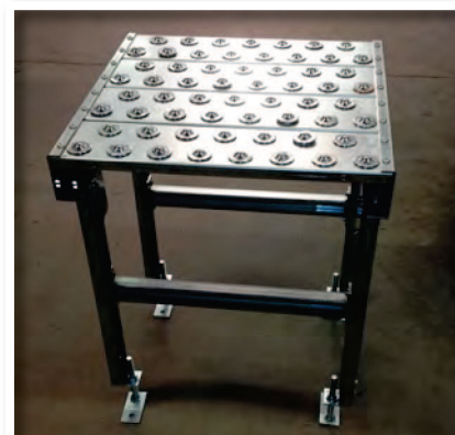
Table à bille