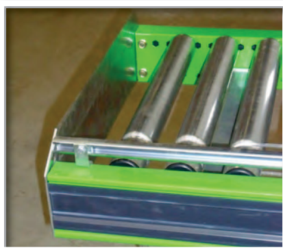
Butée extrémité fixe. Guide latéral

Les rouleaux sont libres, la charge avance soit par gravité (pente de 2 à 6%) soit par action de l'homme.